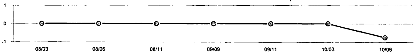
Position Ihres Resultats innerhalb der Gruppe