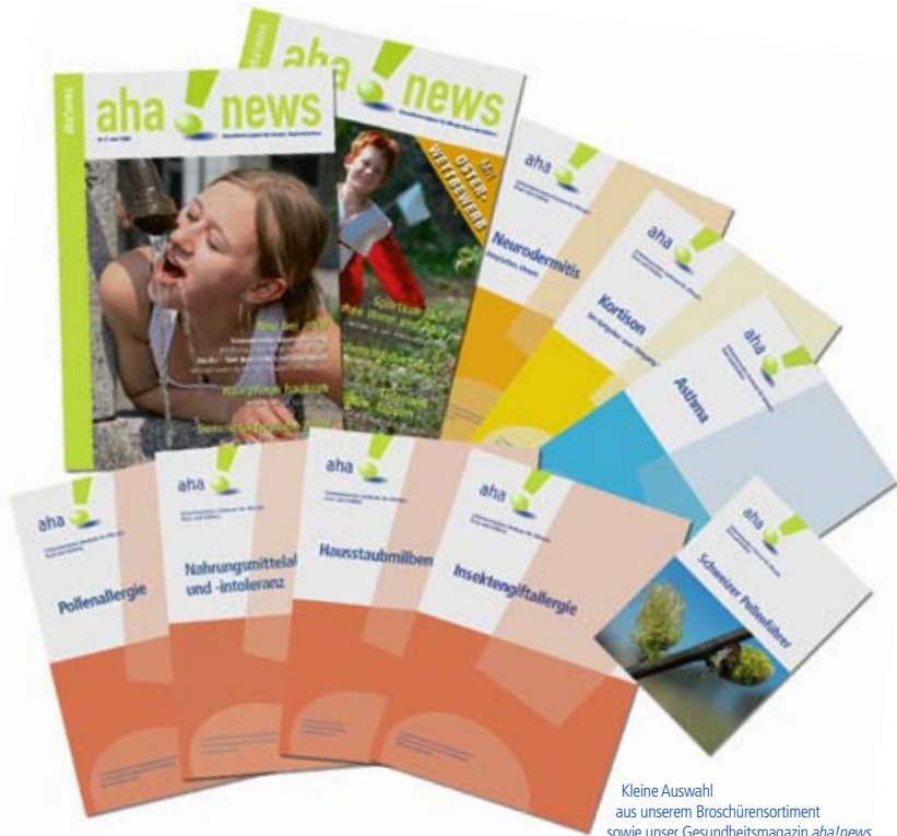
Kleine Auswahl aus unserem Broschürensortiment sowie unser Gesundheitsmagazin aha!news .

Schweizerisches Zentrum für Allergie, Haut und Asthma Centre suisse pour l'allergie, la peau et l'asthme Centro svizzero per l'allergia, la pelle e l'asma